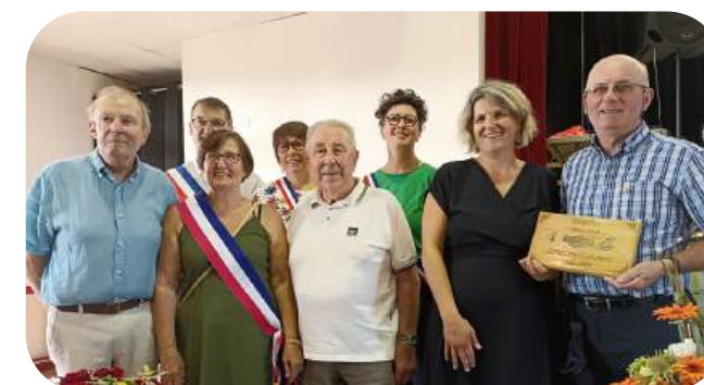
Les maires et anciens maires ont renouvelé leurs engagements aux côtés des représentants des associations.

Au-delà des activités, cet échange a permis de créer des liens avec de nouvelles familles d'accueil et de renforcer la dynamique associative portée par les nombreux adhérents.