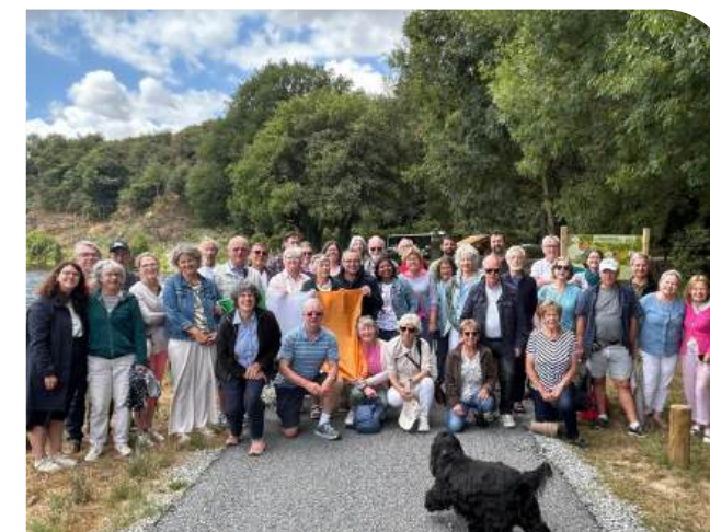
Les membres des deux associations, le jour du départ.